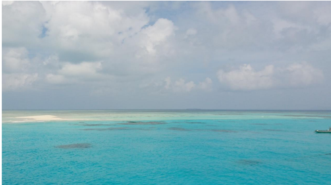
大堡礁的藍，我拍不太出來但實體看到更美