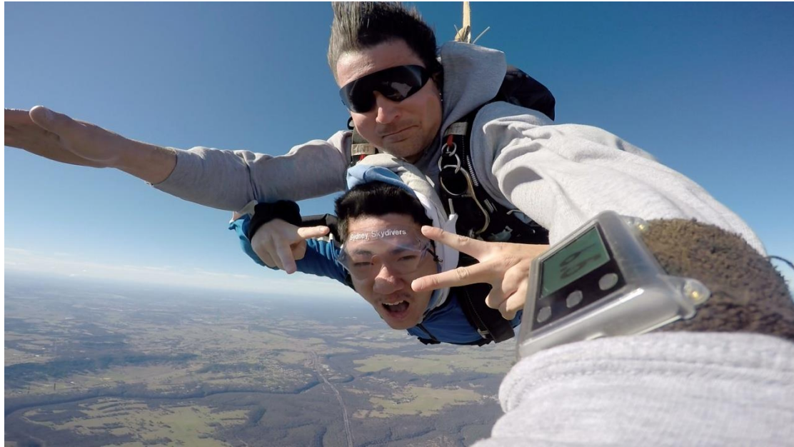
C 在高空照好醜 xd