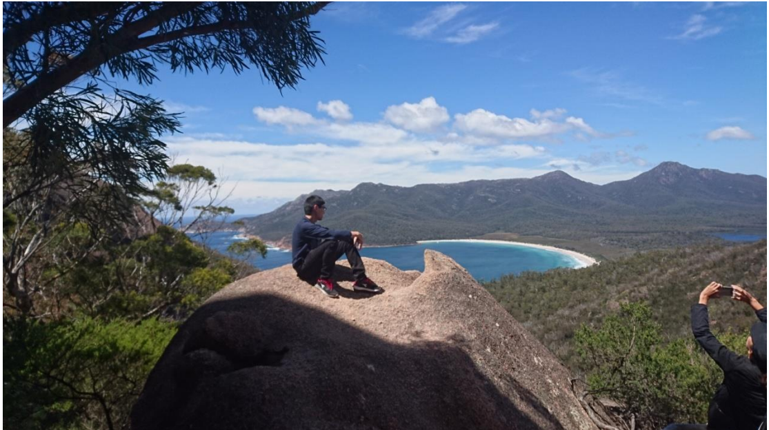
塔斯馬尼亞酒杯灣的壯麗